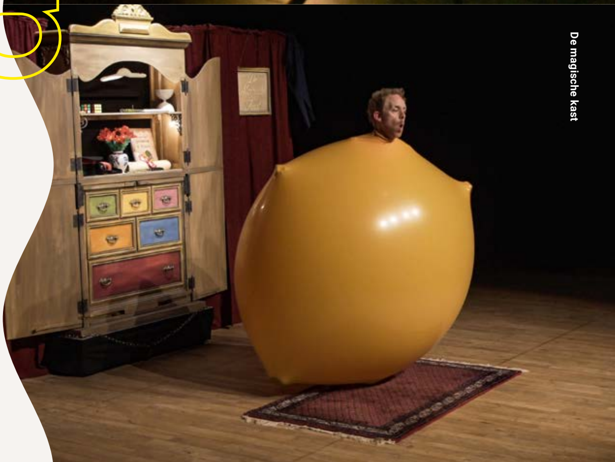
De magische kast