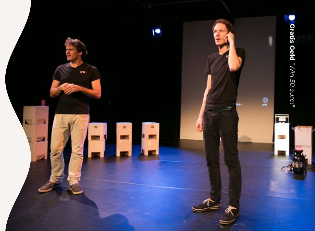
Gratis Geld "Win 50 euro!"

KOSTEN 1X € 1.825,- 2X € 2.325,- 3X € 2.725,- EXCL. REISKOSTEN EN BTW