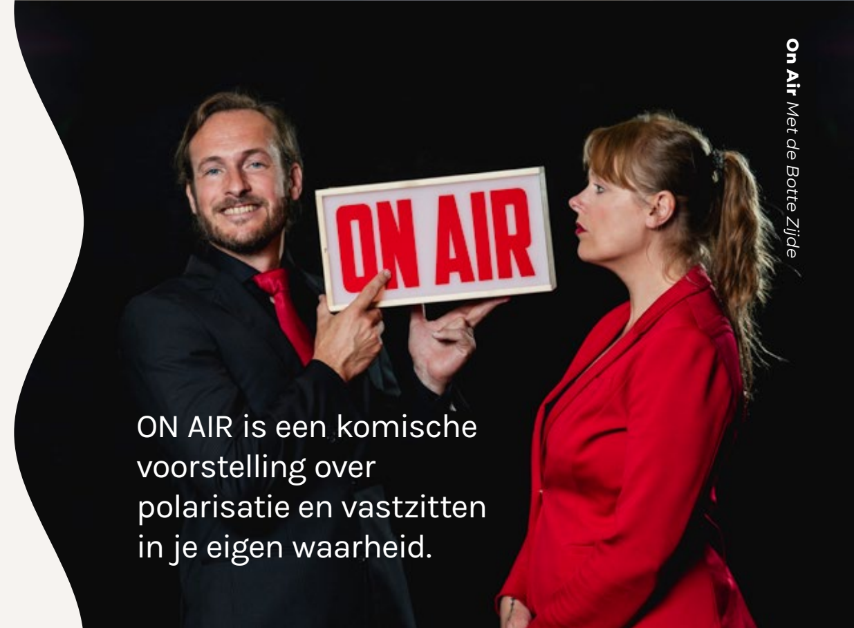
On Air Met de Botte Zijde

ON AIR is een komische voorstelling over polarisatie en vastzitten in je eigen waarheid.