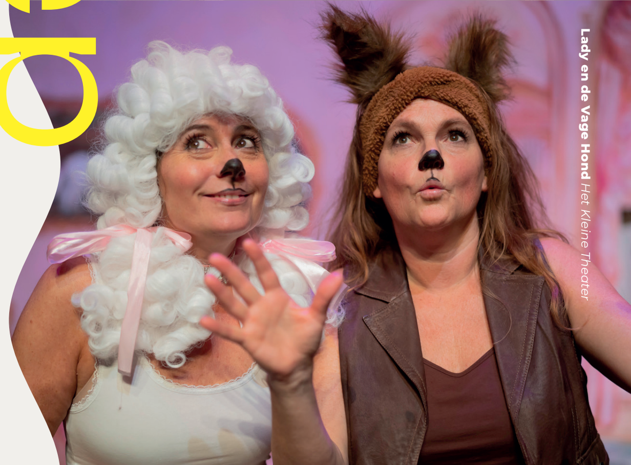
Lady en de Vage Hond Het Kleine Theater