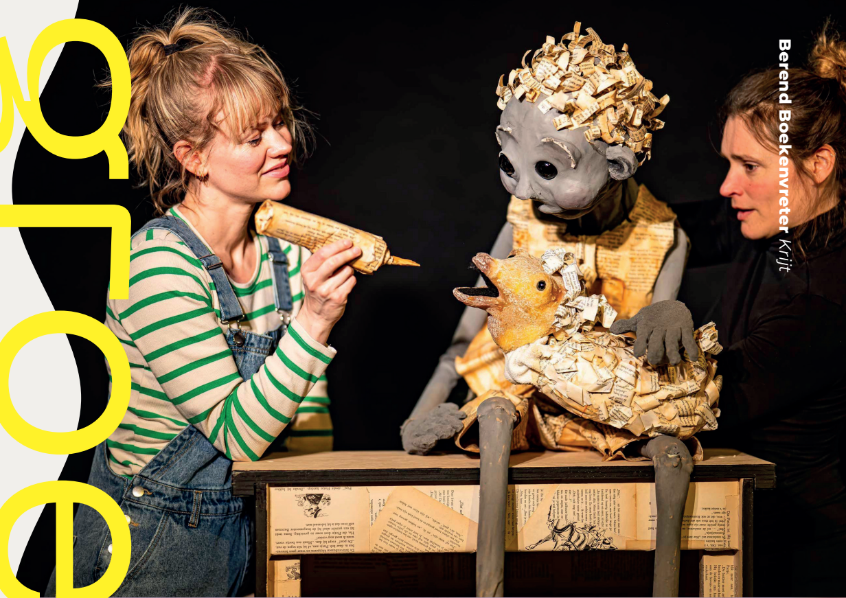
Berend Boekenvreter Krijt